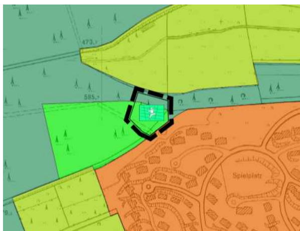
Ausschnitt aus dem rechtskräftigen FNP

Gemäß der im ersten Kapitel genannten Zielsetzung der 41. Änderung des Flächennutzungsplans der Hansestadt Medebach gestaltet sich die Änderung wie folgt: