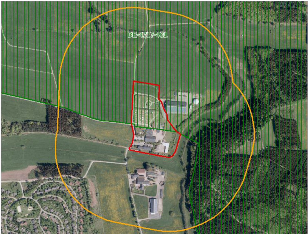
Abbildung 7: Abgrenzung des Wirkraumes (orange Linie) und des Plangebietes (rote Linie) (Karten- grundlage: GEOBASIS NRW 2019).