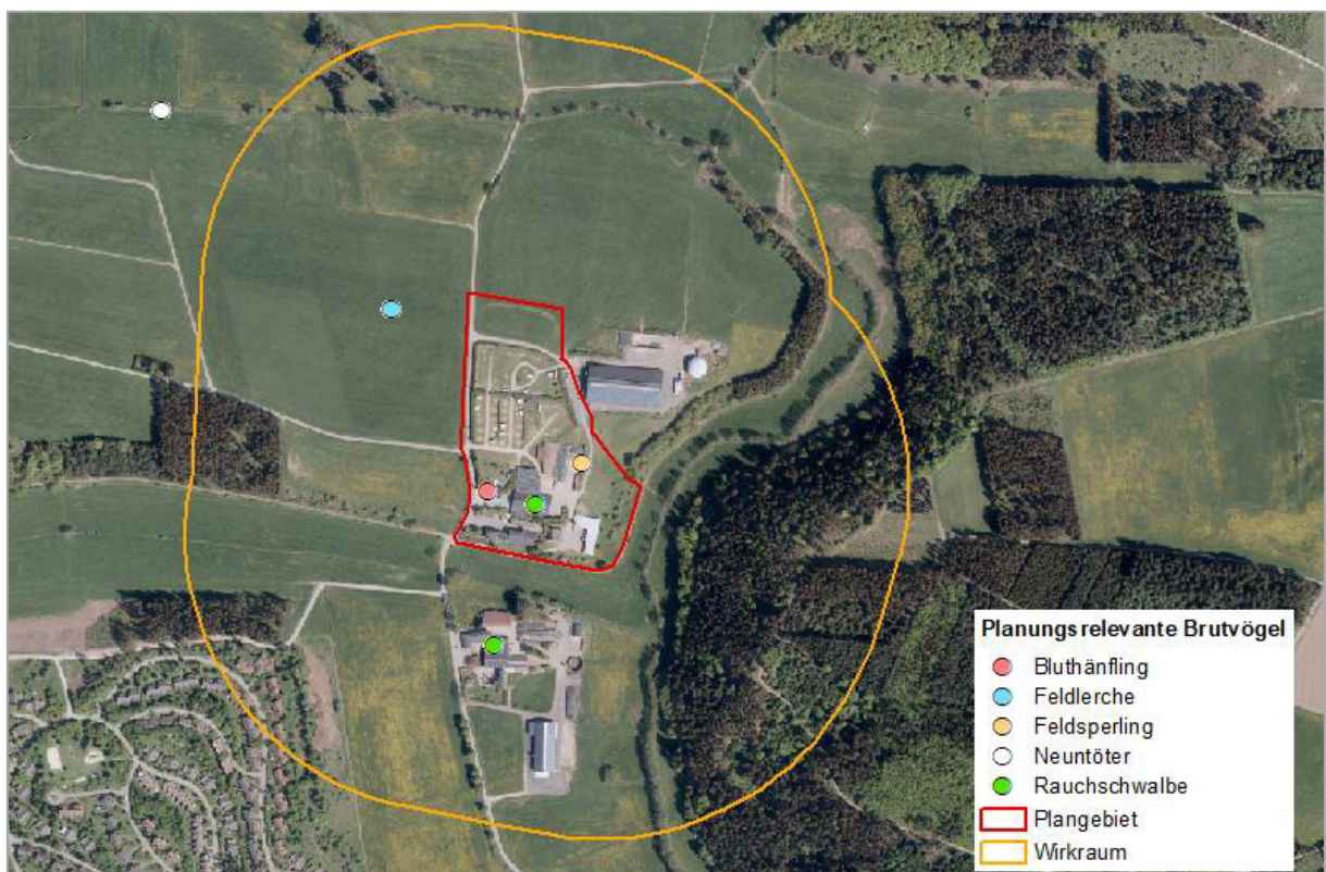
Abbildung 9: Reviermittelpunkte planungsrelevanter Vogelarten.

Neben den planungsrelevanten Arten konnte zudem noch eine Reihe weiterer Vogelarten wie Amsel, Wacholderdrossel, Elster, Rabenkrähe, Dohle, Blaumeise, Kohlmeise, Sumpfmeise, Grünfink, Buchfink, Stieglitz, Rotkehlchen, Mönchsgrasmücke, Dorngrasmücke, Goldammer, Steinschmätzer, Haussperling, Hausrotschwanz, Bachstelze, Gimpel, Heckenbraunelle, Sommergoldhähnchen, Zilpzalp, Nilgans und Stockente im Untersuchungsgebiet festgestellt werden.