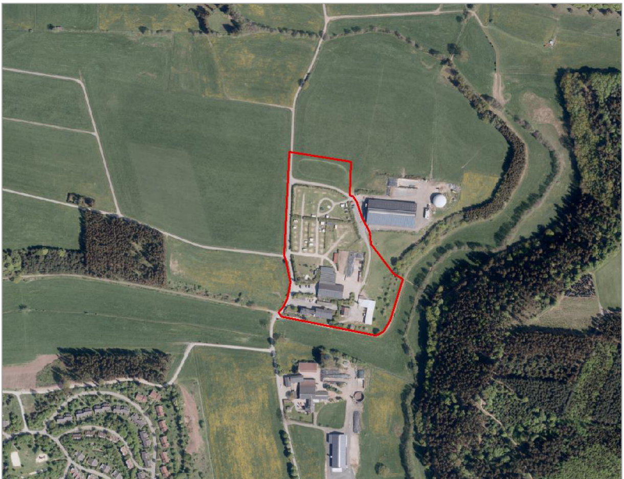
Abbildung 5: Abgrenzung des Plangebietes (Kartengrundlage: GEOBASIS NRW 2019).

Die im Bebauungsplan Nr. 40 dargestellten Sondernutzungen (SO - 1, SO - 2 und SO - 4) bestehen bereits. Die Fläche SO - 3 unterliegt aktuell noch der Grünlandnutzung (Abbildung 5). Vereinzelt befinden sich Gehölze entlang der Wege. Alle Teilflächen, die als Campingplatz genutzt werden, werden mit Hecken aus heimischen und standortgerechten Hecken eingegrünt (vgl. Abbildung 4). Im Südosten des Plangebietes befinden sich eine private Grünfläche sowie eine Fläche zum Erhalt von Obstbäumen (Abbildung 6). Das Plangebiet liegt überwiegend im Vogelschutzgebiet „Medebacher Bucht“ und ist von Grünland umgeben. Südwestlich des Plangebietes befinden sich der Center Parcs Park Hochsauerland und der Aventura Spielberg, südlich liegt der Hof Schreiber.