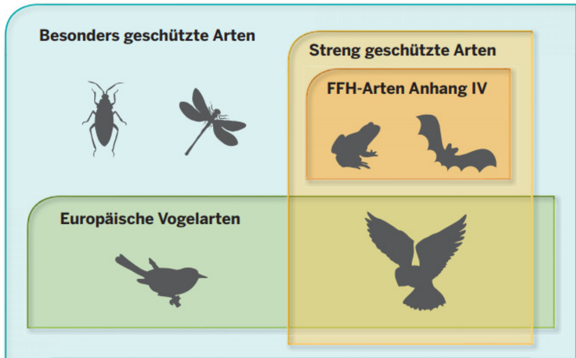
Abbildung 2: Schutzkategorien nach nationalem und internationalem Recht (KIEL 2015).

Da es sich bei der naturschutzfachlich begründeten Auswahl nicht sicher um eine rechtsverbindliche Eingrenzung des zu prüfenden Artenspektrums handelt, kann es im Einzelfall erforderlich sein, dass weitere Arten (z.B. bei Arten, die gemäß der Roten Liste im entsprechenden Naturraum bedroht sind, oder bei bedeutenden lokalen Populationen mit nennenswerten Beständen im Bereich des Plans/Vorhabens) in die Prüfung aufzunehmen sind.