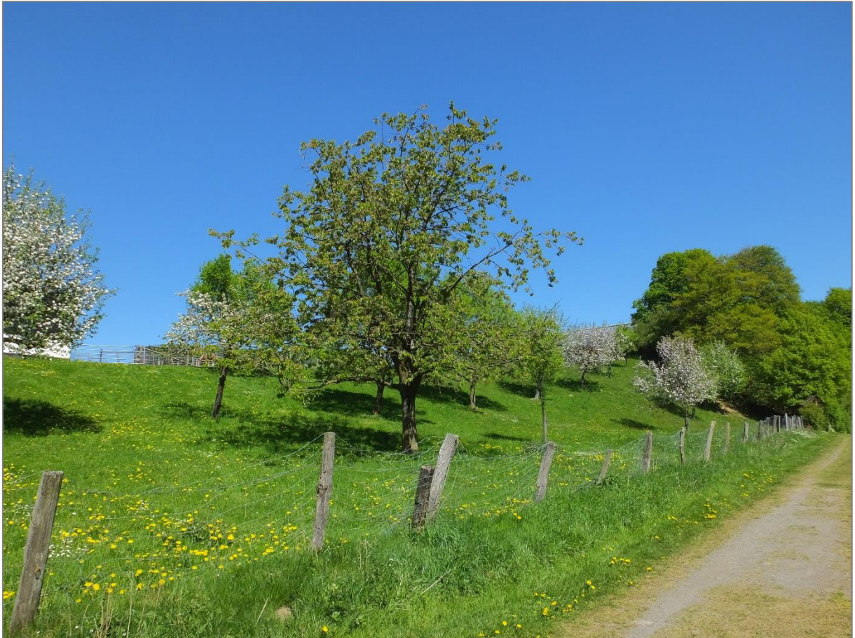
Abbildung 6: Private Grünfläche mit Obstbaumbestand.