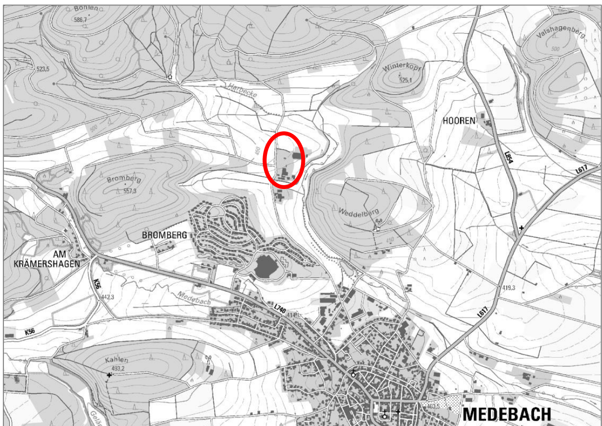
Abbildung 1: Übersichtskarte mit Lage des Plangebietes (rote Umrandung) (Kartengrundlage: GEOBASIS NRW 2019).

Das Plangebiet befindet sich im Norden der Stadt Medebach (Abbildung 1) und umfasst innerhalb der Gemarkung Medebach, Flur 47 die Flurstücke 167, 84/1, 84/2 und 85 sowie Teile der Flurstücke 102 bis 105, 148, 149 und 86. Das Plangebiet ist von Wohn- und Ferienhäusern, Ställen zur Unterbringung von Haus- und Nutztieren, dem bestehenden Campingplatz sowie von Weide-, Wiesen- und Gartenflächen bestanden. Das Plangebiet liegt überwiegend im Vogelschutzgebiet „Medebacher Bucht“.