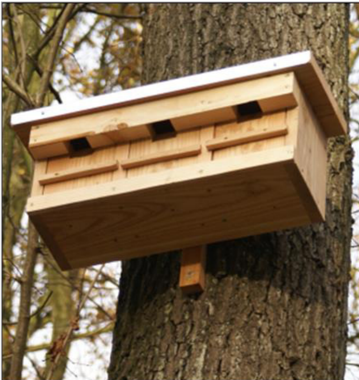
Abbildung 10: Nisthilfen für Feldsperlinge (HEBEGRO GBR o.J.)

Ein maßnahmen- und/oder populationsbezogenes Risikomanagement/Monitoring ist nicht erforderlich (LANUV NRW 2019, FÖA LANDSCHAFTSPLANUNG 2013).