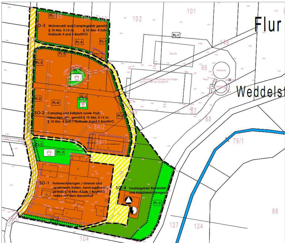
Abbildung 4: Auszug aus dem Bebauungsplan Nr. 40 „Ferienhof zur Hasenkammer“ (CHRISTOPHHESE-ARCHITEKTEN & BÜRO BÖHMER 2020a. Stand: 18.03.2020).

Das Bauleitplanverfahren hat die nachhaltige Standortsicherung der Betriebes Ferienhof zur Hasenkammer zum Ziel. Das Plangebiet befindet sich nördlich der Kernstadt Medebach. Die Teilflächen SO – 1, SO – 2 und SO – 4 sind bereits überwiegend durch den Ferien- und Campingbetrieb genutzt und werden überplant (Abbildung 4). Die Fläche SO – 3 ist Teil einer Grünlandfläche, die intensiv bewirtschaftet wird. Die bestehenden Hecken, welche die die Teilgebietsflächen SO – 1 bis SO – 3 eingrünen, werden im Rahmen der Aufstellung des Bebauungsplanes festgesetzt. Das gesamte Plangebiet soll mit Heckenstrukturen eingegrünt werden. Die Teilfläche SO – 4 wird als Sondergebiet für Elektrizität und Abfalleinrichtungen festgesetzt.